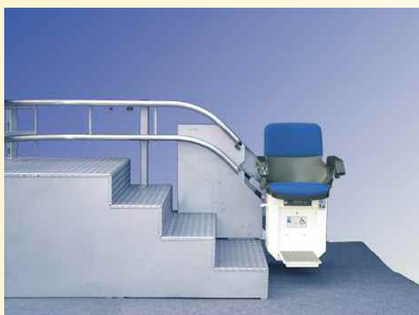
Le rail escamotable