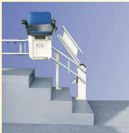
Le rail relevable

Assez souvent, on rencontre au bas de l'escalier, une porte ou un passage qui ne doit pas être obstrué par des rails de guidages fixes.