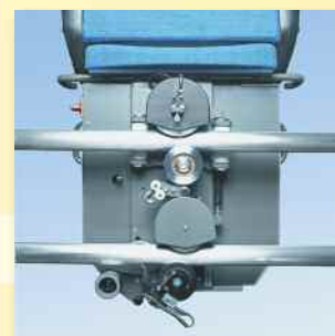
Système de galet

Chaise élévatrice fonctionnant par un système à adhérence breveté.